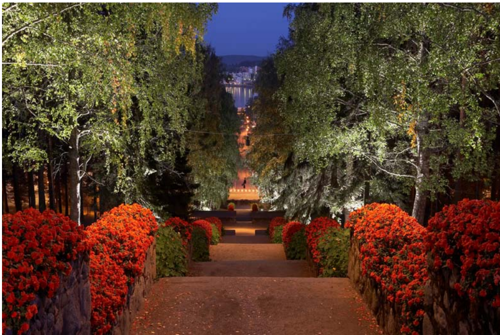
Harjun portaat.

Jääkauden aikainen muodostuma Harju toimii kauniina taustana kaupungin keskustalle. Harju on Jyväskylän maamerkki ja parhaiten tunnettu näköalatornistaan ja viheralueistaan. Alueella on kävelypolkuja, urheilukenttä ja Vesilinna, jossa on näköalatorni, näköalaravintola sekä Keski-Suomen luonnontieteellinen museo.