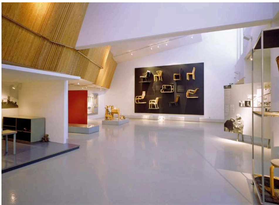
Alvar Aalto -museon perusnäyttely Alvar Aalto. Arkkitehti.

Alvar Aalto -museon pysyvä näyttely tutustuttaa vierailijansa Aallon värikkääseen elämään sekä merkittävän laajaan tuotantoon, joista esimerkkeinä kaupunki- ja sisustussuunnittelu, valokuvat, huonekalut sekä lasituotteet. Museossa on myös vaihtuvien näyttelyiden tila, jossa pääsee tutustumaan mm. nykyarkkitehtuuriin ja suunnitteluun.